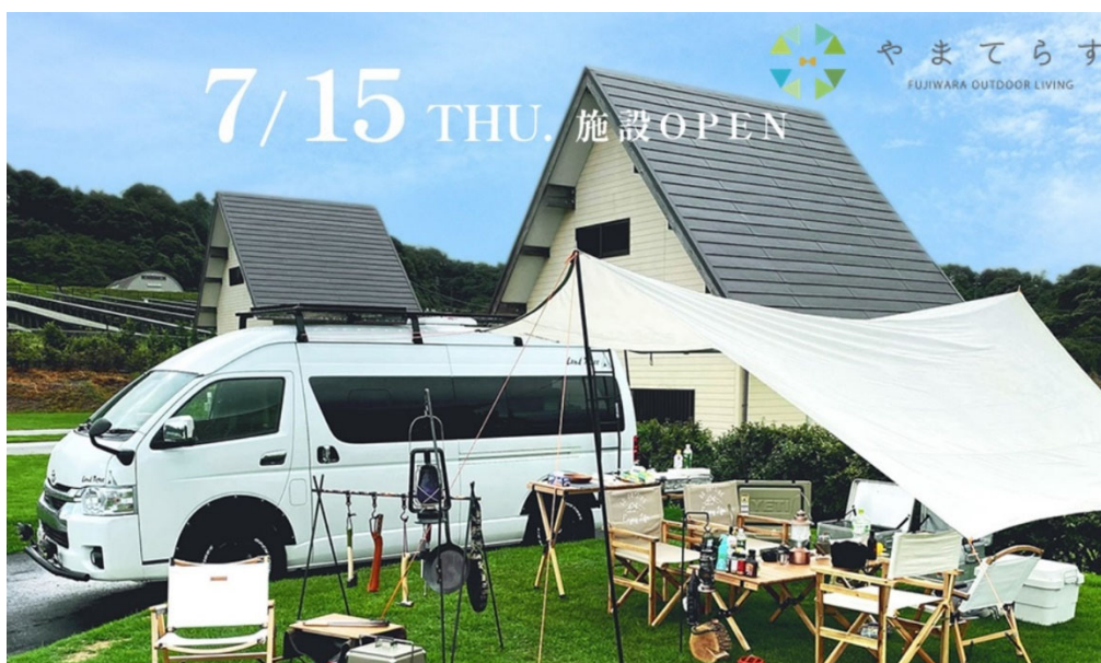
7月15日(木)にオープンしたアウトドア施設「やまてらす」

三重県いなべ市の出展情報： https://asomobi.com/exhibitor/6/