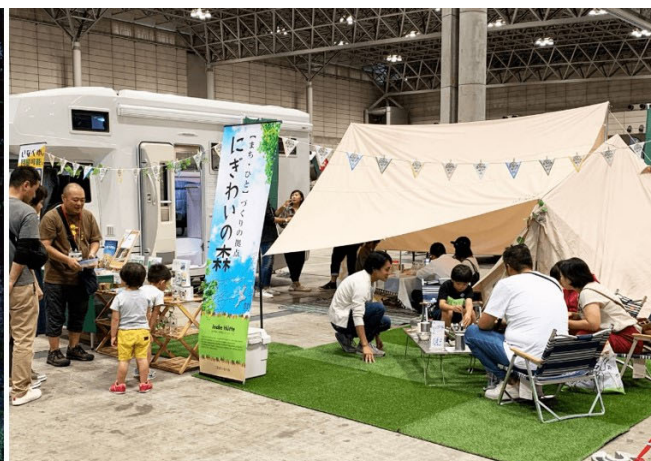
いなべ市が推進する Hygge（左）施設の紹介や「グリーンクリエイティブいなべ」コンテンツを展開

また同市で 2022 年春に開業予定の、Hygge(ヒュッグ)-豊かな時間の過ごし方-をコンセプトに Nordisk と共創するアウトドア施設「Nordisk Hygge Circles UGAKEI」の紹介や、グリーンクリエイティブいなべ関連展示・体験及び Nordisk 商品販売等を行なう予定です。